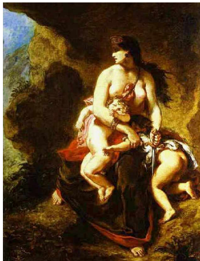
Delacroix – Medea uccide i figli, 1838

Come Euripide esce fuori dal coro sostenendo quanto poco dignitosa sia la condizione delle donne nell’antica Grecia, anche Menandro (Atene, demo di Cefisia 342 a.C. - 290 a.C.), il massimo esponente della commedia nuova , dimostra una straordinaria sensibilità nel dipingere personaggi tradizionalmente tenuti in poco conto dall’opinione corrente: la cortigiana solitamente sensuale, traditrice, sleale, egoista, diventa un esempio di onestà e affidabilità (pensiamo ad Abrotono nella commedia “gli Epitrepontes ” o a Criside nella commedia “la Samia ”), così come il servo tradizionalmente ritenuto un parassita, imbrogliatore viene ad essere riscattato nella commedia “l’ Aspis ”).